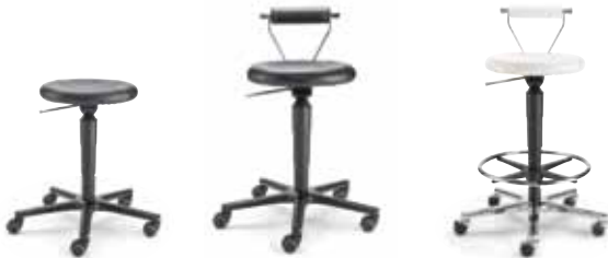
ROL2 F8M1R 47 - 65 cm