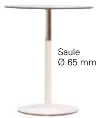
TT 70 -112 cm