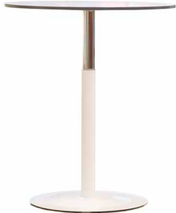
TT 70 -112 cm

Details zu höhenverstellbaren Besprechungs- und Schreibtischen auf Anfrage! Details of adjustable tables and desks on request !