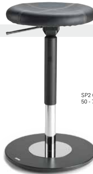
SP2 0702R 50 - 70 cm

„Die balancierende Sitz-/Stehhilfe LeitnerSpin überzeugt durch sein gut durchdachtes Konzept, welches ergonomisches Sitzen und ansprechendes Design vereint. Die speziell geformte Sitzfläche unterstützt eine aufrechte Sitzhaltung. Beim bewegten Sitzen hat man einen guten Halt und sitzt bequem. Man könnte fast sagen, man sitzt wie auf einer Wolke. Selbst Rückenpatienten können mit diesem Hocker entlastet und beschwerdefrei sitzen.“