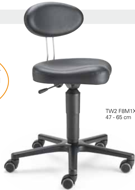
TW2 F8M1XL 47 - 65 cm

LeitnerTwist 2 Das Leitner Original mit der speziellen Sattelsitzform und den vielen Ausstattungsmöglichkeiten