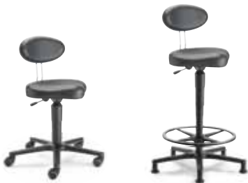
TW2 F8M1XL 47 - 65 cm