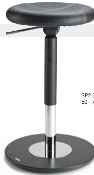
SP2 0702R 50 - 70 cm

„Die balancierende Sitz-/Stehhilfe LeitnerSpin überzeugt durch sein gut durchdachtes Konzept, welches ergonomisches Sitzen und ansprechendes Design vereint. Die speziell geformte Sitzfläche unterstützt eine aufrechte Sitzhaltung. Beim bewegten Sitzen hat man einen guten Halt und sitzt bequem. Man könnte fast sagen, man sitzt wie auf einer Wolke. Selbst Rückenpatienten können mit diesem Hocker entlastet und beschwerdefrei sitzen.“