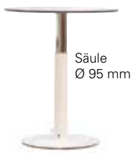
Säule Ø 95 mm