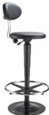
LeitnerStabil WS3S 9101R 54-79 cm

Infinitely adjustable bar stools from three product ranges: LeitnerStabil, LeitnerBar, LeitnerRoll For more information see www.ergomoebel.at