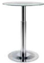
TT 70 -112 cm