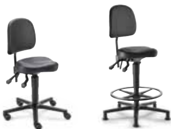
MVS2 F8M1XL 47 - 65 cm