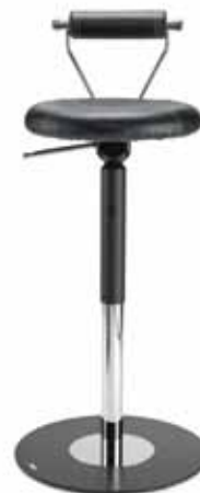
LeitnerBar BA3 7702R 66-82 cm