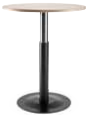
TT 70 -112 cm