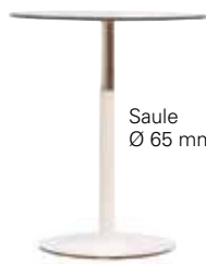
Säule Ø 65 mm