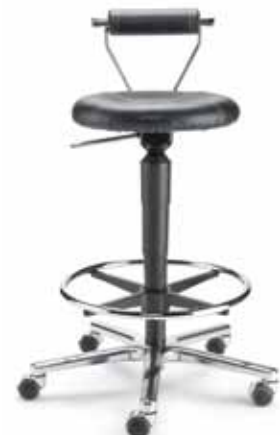
LeitnerRoll ROL3 F8M1R 56-8 cm