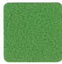
KF 7013 grün