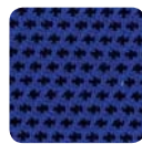
DM 04 blau