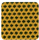
DM 05 gelb