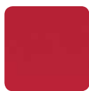
PE 78 rot