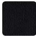
PE 99 schwarz

PERI ist ein hochwertiges, phthalatfreies Vinyl Polstermaterial. Es zeichnet sich durch exzellente Lichtechtheit, Abriebeigenschaften und Pflegeleichtigkeit aus. Es ist desinfizierbar, feuchtigkeitsabweisend, Speichel- und Schweißsecht, Urin- und Blutbeständig. Phthalatfreie Objektkunstleder sind besonders empfohlen für Einsatzbereiche mit Kindern als auch für den Gesundheits- und Wellnessbereich. > 55.000 Scheuertouren nach Martindale