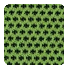
DM 07 grün