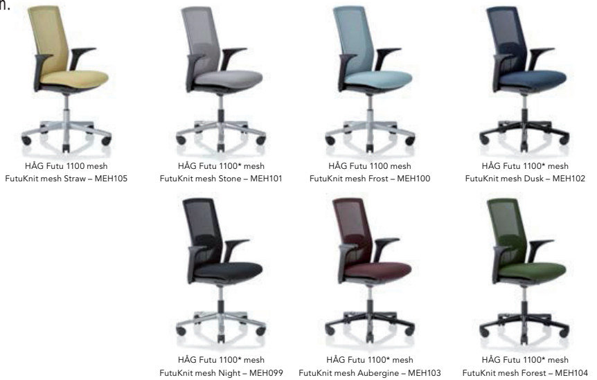
HÅG Futu 1100 mesh FutuKnit mesh Straw – MEH105